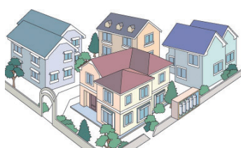
集団供給のお客様