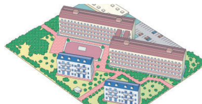
コミュニティーガス団地のお客様