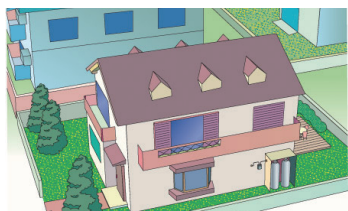
個別供給のお客様

※工場など生産現場での高圧ガス保安法上の消費者、国及び地方公共団体は対象外となります。