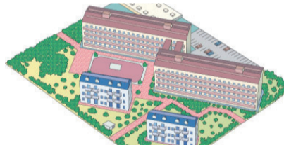
コミュニティーガス団地のお客様